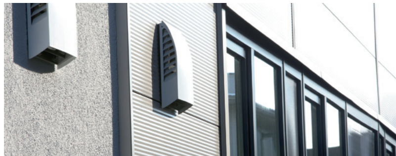
Die Außenansicht der dezentralen Lüftungsgeräte.

triebenen Klappenstellmotoren, vier digitalen Temperatur- und zwei Feuchtefühlern sowie dem CO 2 -Fühler sorgen beim Betrieb der Lüftungsgeräte für Energieeffizienz und ein gutes Raumklima. Im Sommerbetrieb schaltet das Gerät auf eine Nachtlüftung um (freie Kühlung).